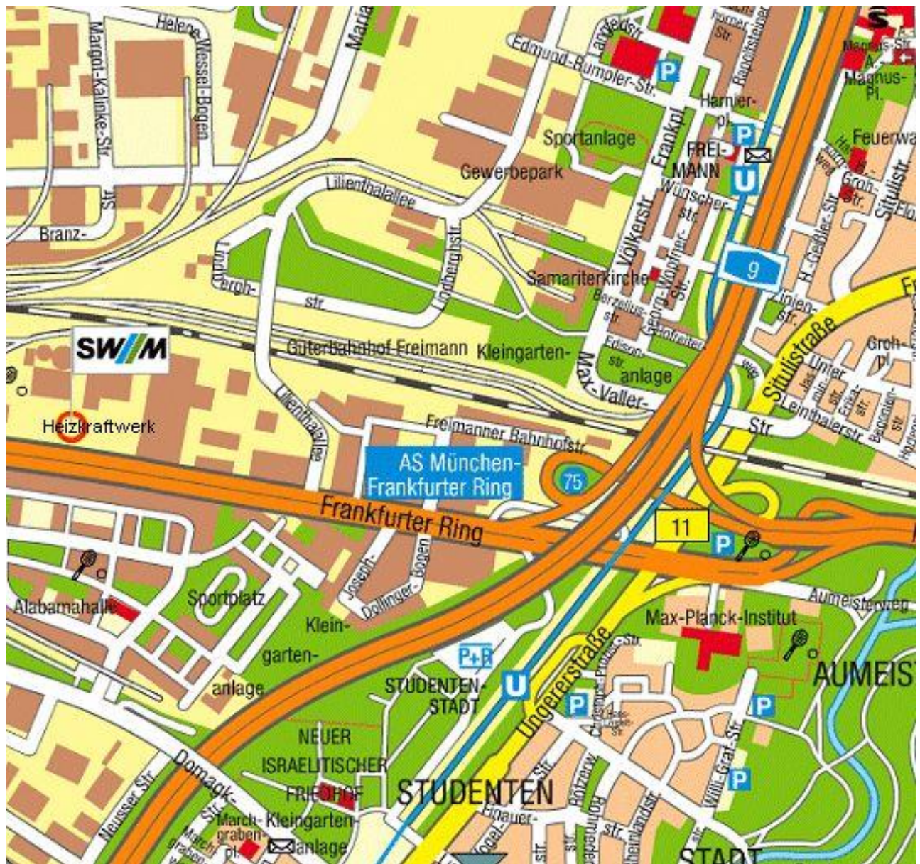
Abb. 1-1: Umgebungskarte ohne Maßstab

Der Standort der geplanten Anlage, das HKW Freimann, befindet sich im Münchner Stadtteil Schwabing-Freimann (Stadtbezirk 12). Die Zufahrt zum Heizkraftwerk erfolgt direkt vom Frankfurter Ring (siehe Abb. 1-1).